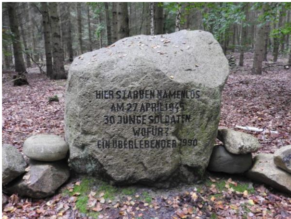
Gedenkstein an der Wegkreuzung zwischen Laagen- und Briesensee. Die Inschrift lautet:

Dies führt uns zu einem Gedenkstein, der im Norden der Schorfheide liegt, an der schmalen Landenge zwischen dem Laagensee und dem Briesensee. Dieser Stein ist zwar längst nicht so schön poliert wie der Jagdtrophäenstein des Kaisers, er trägt auch keine goldene Inschrift, aber er erinnert uns an Wichtigeres als die Jagderfolge eines deutschen Kaisers – an die Opfer des 2. Weltkrieges.