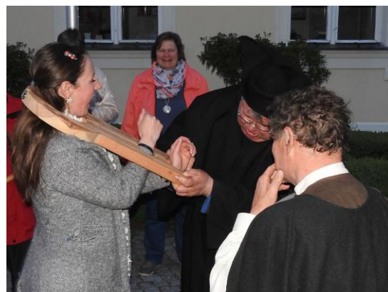
Zweifelhaftes Vergnügen: Die Schandgeige wird angelegt.

Gruppe führte nun über den Angermünder Marktplatz zurück zum Franziskaner-Kloster. Dort nahm der Landvogt dem reuigen Sünder das Versprechen ab, nun nie mehr die Glaubensgrundsätze der Kirche in Frage zu stellen.