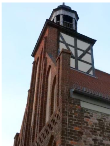
Die Heilig-Geist-Kapelle der französisch reformierten Gemeinde

zu lassen. Und um seinen Kopf zu retten tat er wie ihm geheißen. Er wurde gleich darauf in die Schandgeige geschlagen und schließlich zum Landvogt geführt.