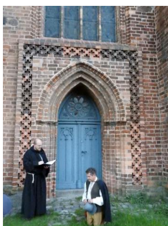
Der Fall des Waldensers wird vor der Marienkirche verhandelt. Hintergrund: Im Jahr 1336 wurden 14 Angermünder Frauen und Männer dem Feuer übergeben, da sie der Ketzerei verdächtigt wurden. Zuvor wurde ein Drittel der Einwohner verhört.