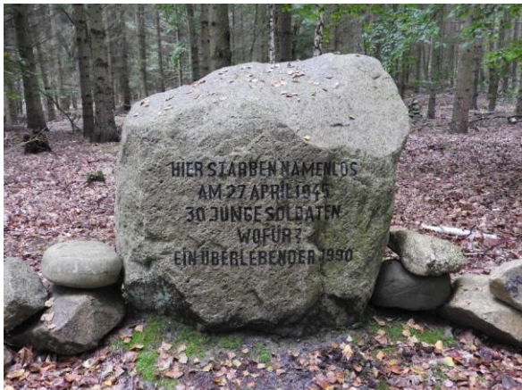
Gedenkstein an der Wegkreuzung zwischen Laagen- und Briesensee. Die Inschrift lautet:

Dies führt uns zu einem Gedenkstein, der im Norden der Schorfheide liegt, an der schmalen Landenge zwischen dem Laagensee und dem Briesensee. Dieser Stein ist zwar längst nicht so schön poliert wie der Jagdtrophäenstein des Kaisers, er trägt auch keine goldene Inschrift, aber er erinnert uns an Wichtigeres als die Jagderfolge eines deutschen Kaisers – an die Opfer des 2. Weltkrieges.