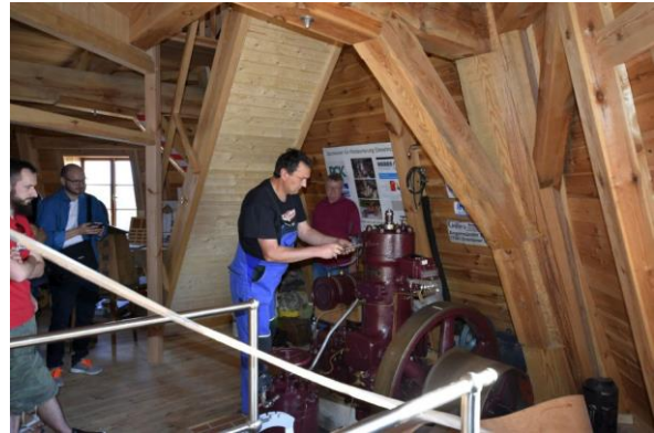
Natürlich wurde an diesem Tag auch der Dieselmotor in Betrieb gesetzt.