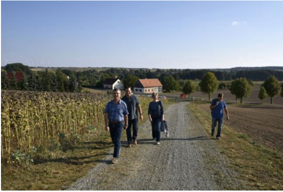
Die ersten Gäste bewältigen den Mühlenberg.