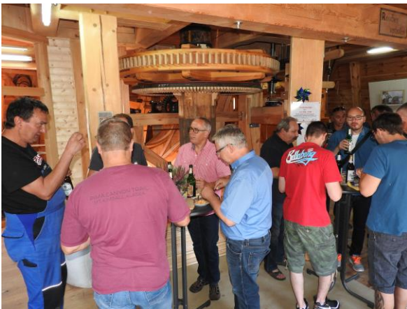
Danach ließen es sich die Gäste schmecken.