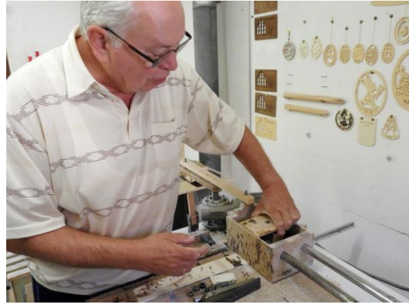
Fensterbilder, Aufhänger und Schwibbbögen erhalten nach dem Fräsen auf dieser selbstgebauten Maschine den letzten Schliff.