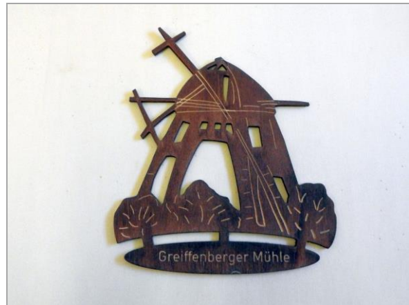
Die Greiffenberger Mühle diente als Vorbild für diese Aufhänger (Entwurf: Astrid Völker-Strack).