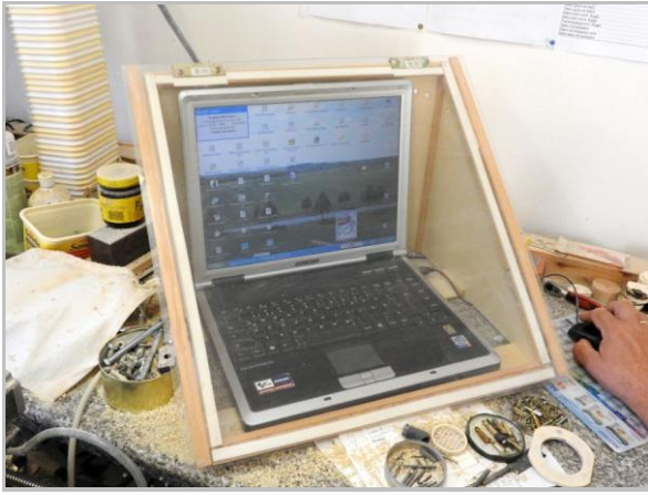
Obwohl der beim Fräsen entstehende Staub abgesaugt wird, ist der Steuerrechner zusätzlich gekapselt.