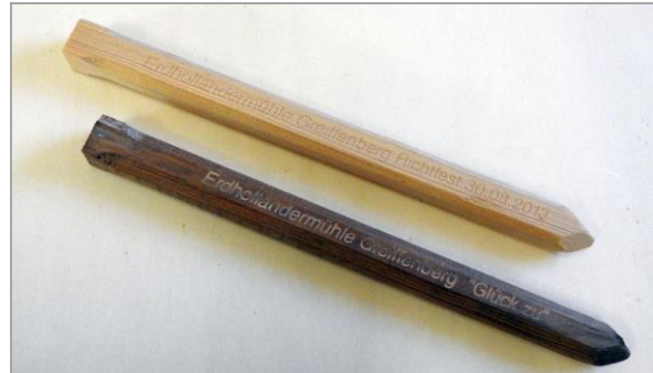
Zum Mühlen-Richtfest am 30.8.2013 wurden diese Holznägel als Souvenir angefertigt.