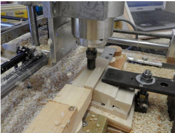
Der Fräser zieht mit bis zu 24.000 Umdrehungen pro Minute seine vorprogrammierte Bahn.