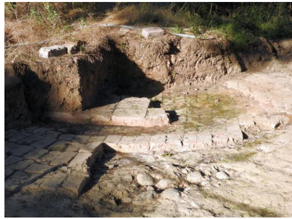
An der südwestlichen Ecke des Burggeländes wurde bei den aktuellen Grabungen ein weiteres rundes Turmfundament entdeckt. Die Burg verfügte also nicht nur über zwei, sondern sogar über drei Türme.

Oliver Schwers beschrieb in seinem Vortrag nicht nur die Zukunft, sondern auch die Geschichte der Burg. Ihr Name geht sehr wahrscheinlich auf den Vogel Greif im pommerschen Wappen zurück, denn sie wurde im 13. Jahrhundert unter pommerscher Herrschaft auf einer natürlichen Anhöhe im Tal des kleinen Flusses Sernitz errichtet.