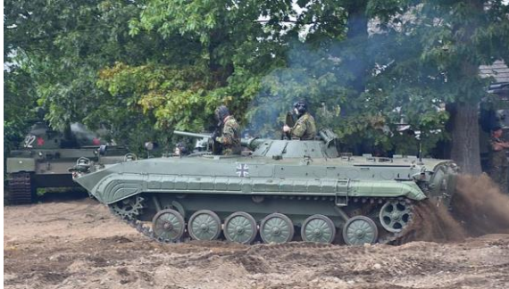
Schützenpanzer BMP1 der Bundeswehr 17

noch zu gebrauchen. Als Zugabe gab es noch 300.000 Kalaschnikows, LKW und Munition. Griechenland erhielt neben den BMP1 weiteres Militärgerät, darunter Flakpanzer ZSU23-4 Schilka, Geschosswerfer und moderne Fla-Raketensysteme 9K33 OKA. 16