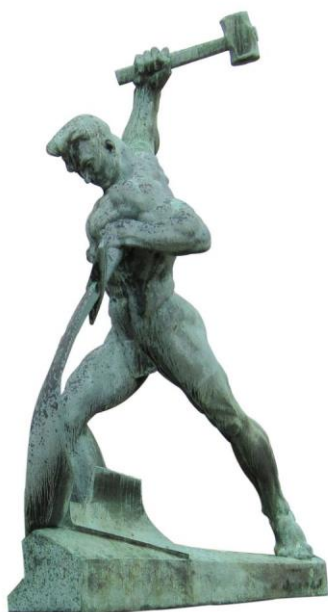
Die Skulptur „Schwerter zu Pflugscharen“ von Jewgeni Wutschetitsch ist ein Geschenk der Sowjetunion an die UNO im Jahr 1959. 8

Kommerzielle Koordinierung (KoKo) an das Tageslicht kamen. Da wurden nicht nur Kunstgegenstände in den Westen verkauft, Müll gegen Devisen importiert und ostdeutsche Pflastersteinstraßen aufgenommen, um westdeutsche Altstadtplätze angemessen aussehen zu lassen. Auch Waffen wurden verkauft, und das vom dem friedliebenden Staat, der DDR. 7 Ein besonderer Exportschlager war dabei die allseits beliebte Kalaschnikow.