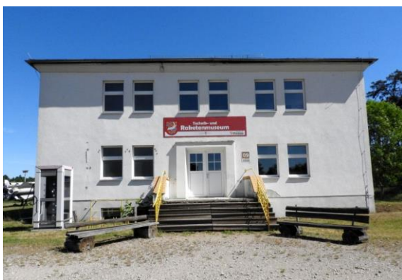
Das Technik- und Raketenmuseum in Pinnow

Frage: Was haben Cap Canaveral in Florida und Pinnow in der Uckermark gemeinsam? Antwort ein Raketenmuseum! Und wie kommt das gerade in die Uckermark? Um eine Antwort zu finden, müssen wir weit zurückgehen, in das Jahr 1938. Wir werden dabei nicht nur die Geschichte dieses Museums, sondern auch eine Geschichte von Rüstung und Abrüstung kennenlernen.