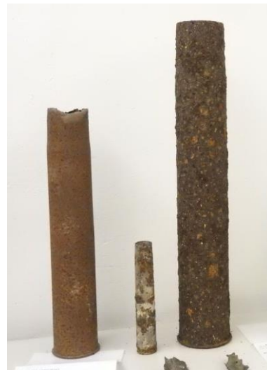
Überreste von Granaten aus der Munitionsanstalt Pinnow, gefunden auf dem Werksgelände

sichts dieser leichten Eroberungen glaubten damals viele Deutsche, dass ein Krieg vermeidbar sei. Doch die vielfältigen Maßnahmen zur Aufrüstung deuteten auf anderes hin. So auch die Auswahl des Dorfes Pinnow durch das Heeresoberkommando der Wehrmacht als Standort für eine Munitionsfabrik. Die Bauarbeiten begannen zügig. Zunächst wurden Straßen gebaut, dann Bunker, Baracken und Fabrikationsanlagen. Während des Krieges mussten sowjetische Kriegsgefangene hier arbeiten, das Werk wurde zweimal Ziel von Luftangriffen.