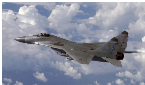
MiG29 der bundesdeutschen Luftwaffe 14

Die erste Variante spart Geld, die zweite kostet etwas, die dritte bringt Geld ein und die vierte macht wenigstens Freunde. Am Ende beschränkt man alle vier Wege. So wurden die damals modernen und begehrten sowjetischen Jagdflugzeuge MiG29 zunächst von der bundesdeutschen Luftwaffe selbst genutzt, und dann im Jahr 2003 für einen symbolischen Preis von 1 € pro Stück an Polen verschenkt. 13