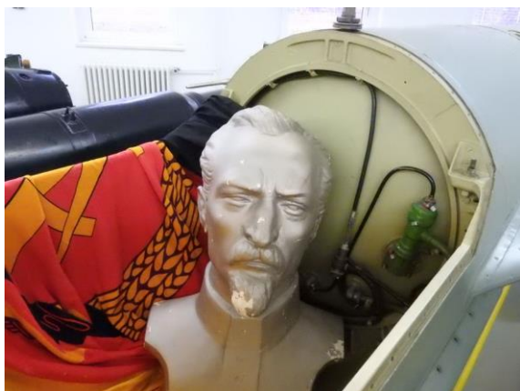
Dzierzynski-Büste in der Rakete

Bei der NVA war es üblich, den Einheiten sogenannte Ehrennamen zu verleihen. In Pinnow gab es deshalb auch eine Einheit mit dem Namen Felix Dzierzynski. 3 Einige Angehörige dieser Einheit erlaubten sich kurz vor der Wende einen Scherz, der gefährlich hätte enden können.